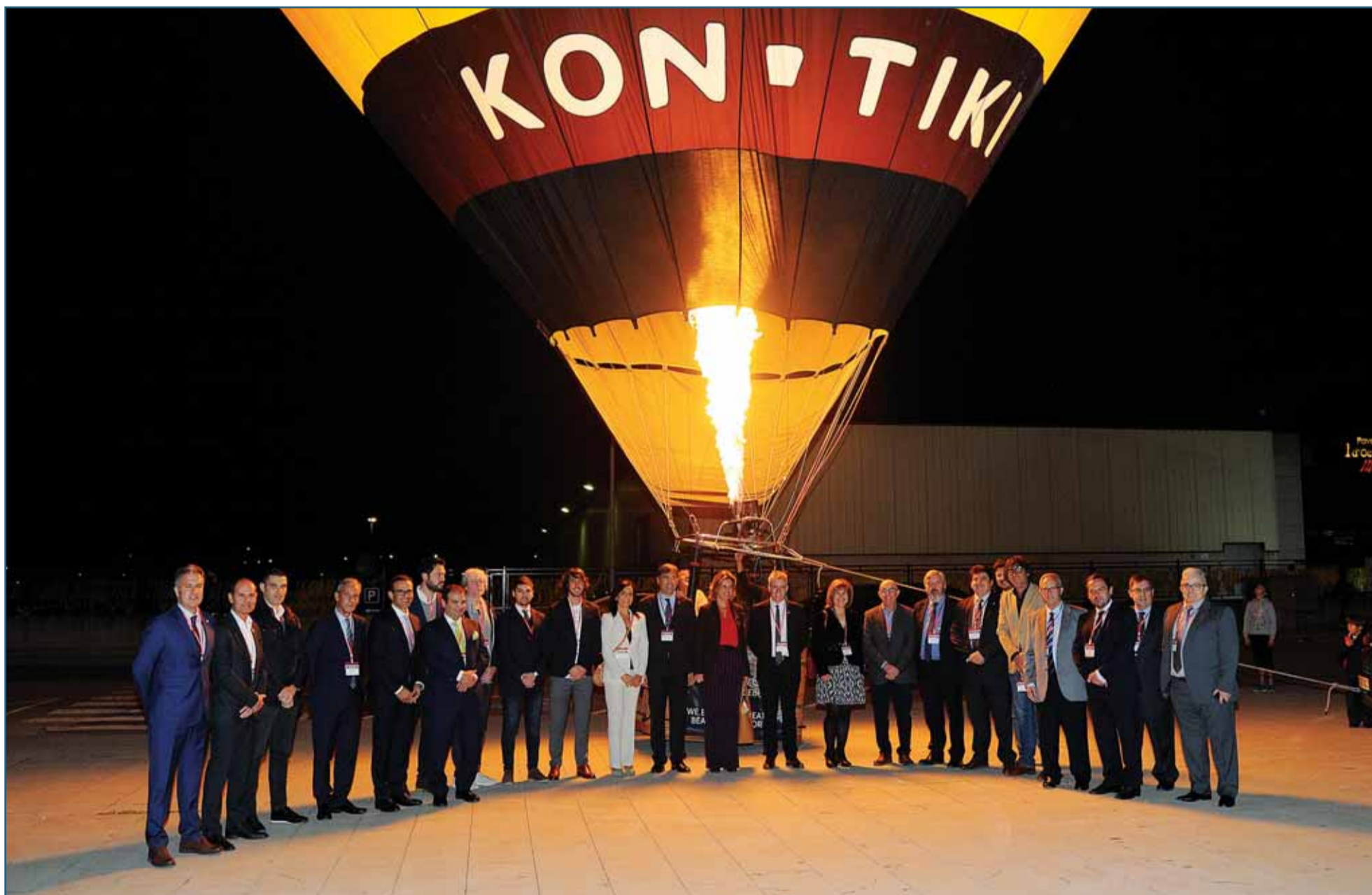
Foto de família de les vuit empreses guardonades i els tres reconeixements lliurats en els Premis Cambra 2018. La gala de l'empresariat ebrenc va tindre lloc a Amposta el 22 de novembre.