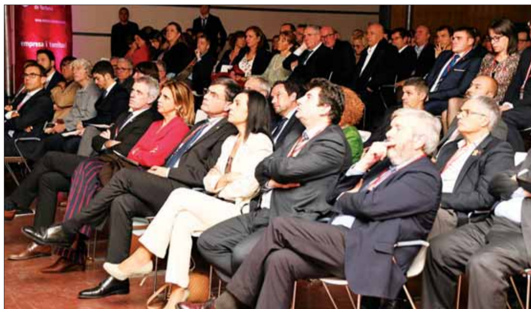
Els Premis Cambra 2018 van comptar amb una nodrida representació del món empresarial ebrec en un esdeveniment totalment consolidat.