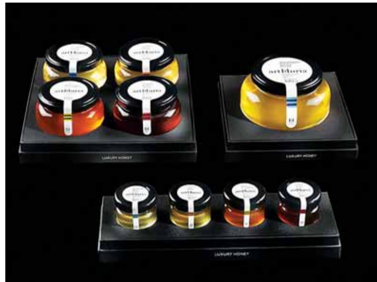
Imatge de la selecció de mels d'Art Muria que ha arribat a les prestatgeries dels establiments de luxe d'Europa, d'Orient Mitjà i d'Àsia.

bia Saudí i Dubai), així com del continent asiàtic (Hong Kong i el Japó). Mel Muria produïx més de 30 referències de mel, si bé les de romaní,