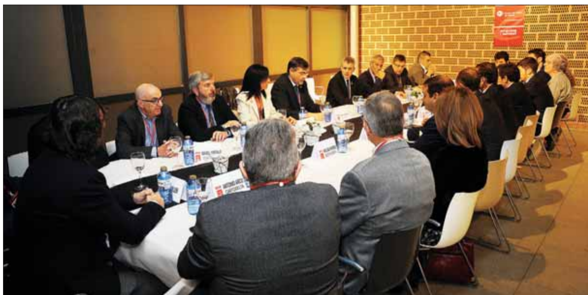
Els guardonats amb els Premis Cambra 2018 i l'executiva de la Cambra de Comerç de Tortosa van reunir-se prèviament a la realització de l'acte.