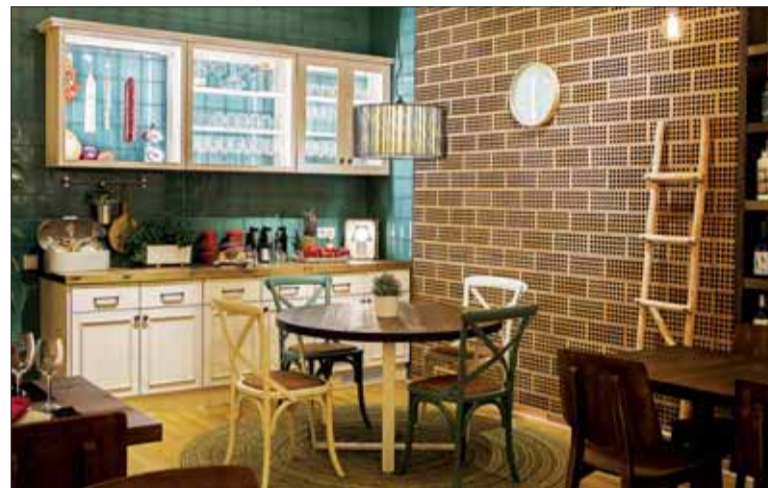
Restaurant realitzat per Equipomadera.

número 30 de Tortosa, un taller de 400 m 2 al polígon industrial del Baix Ebre i un estudi al centre de la ciutat. A més a més, a través del seu web, www.equipomadera.com , gestionen comandes per tota la Península.